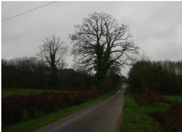
1 ↑ - 2 arbre à capricorne vers St Jean : les 2 plus au nord (vue vers le nord) 2 → - arbre à capricorne vers St Jean : le plus au sud (vue vers l'ouest depuis la route)