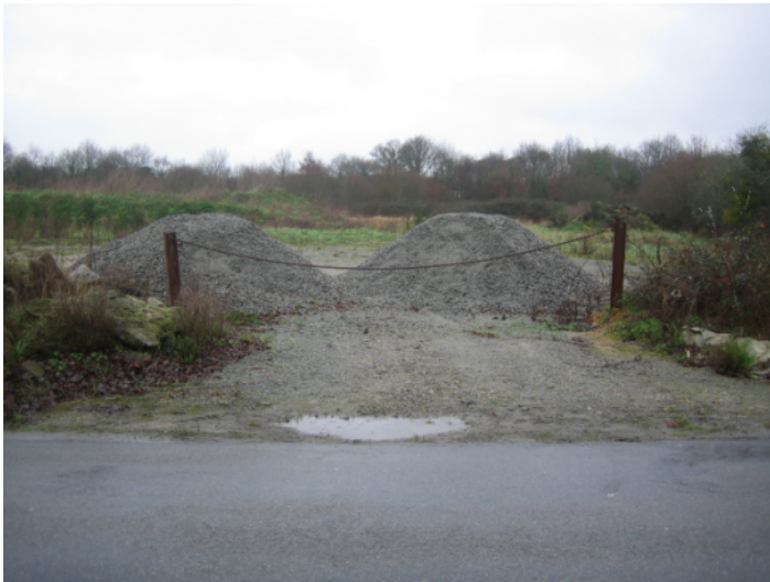
h ↑ - vue de la route de la Croix Rouge vers le nord, un peu plus loin.