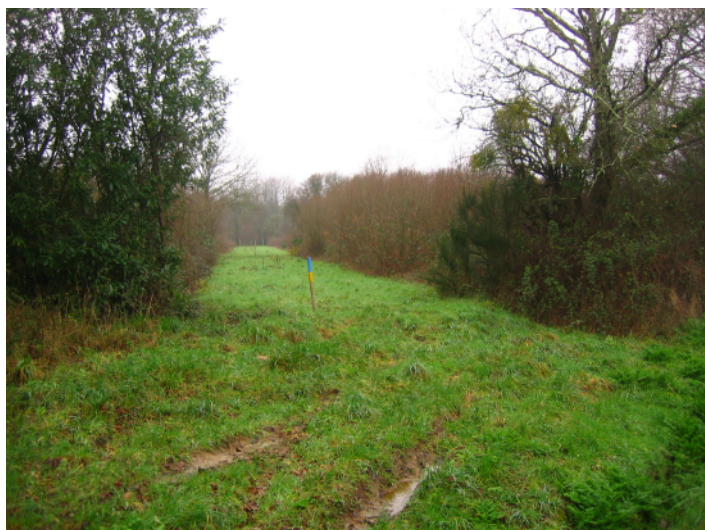
c ↑ - tracé de l'échangeur ouest, vue de la petite route de Malville vers l'ouest.