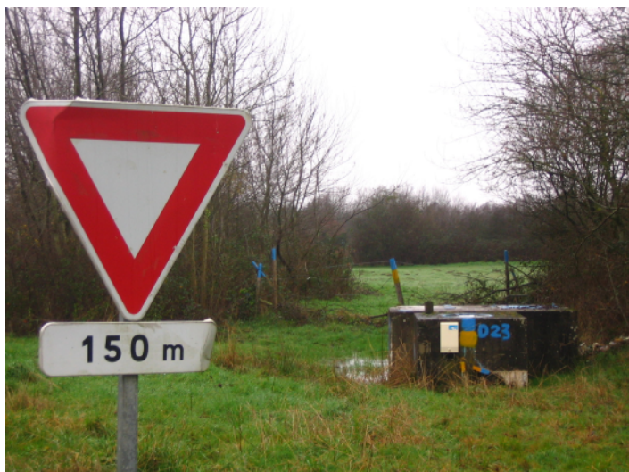
a ↑ - tracé de l'échangeur ouest, vue de l'entrée de la N165 (Nantes-Vannes) vers le nord.