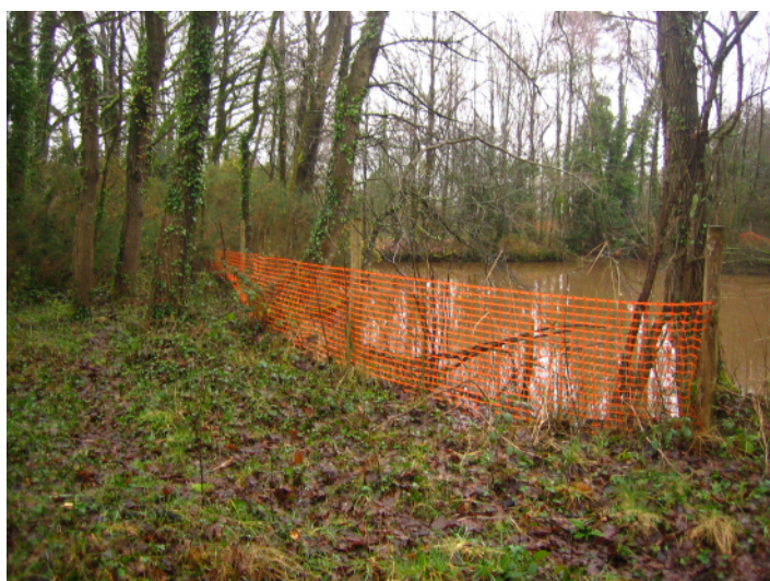
e ↑ - tracé de l'échangeur ouest, 1è mare au sud de la petite route de Malville.