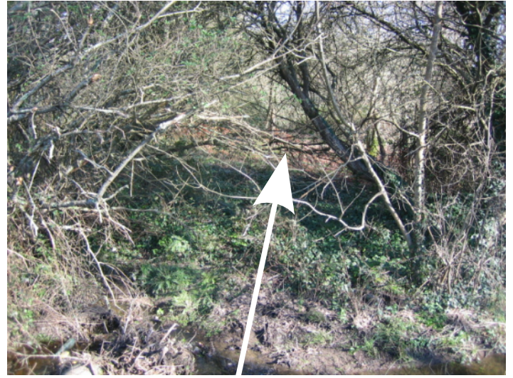
i ↑ - vue de la route de la Croix Rouge vers le nord, noter le filet orange au bout de la flèche.