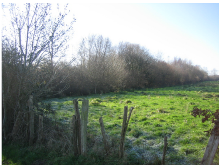
3 ↑ - tracé du barreau routier au sud est de la route de la Fremière (vue de la route vers le sud est)