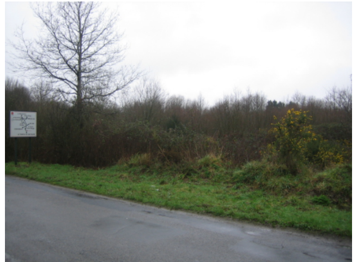
g ↑ - vue de la route de la Croix Rouge vers le nord-ouest, juste avant l'entrée de la zone.