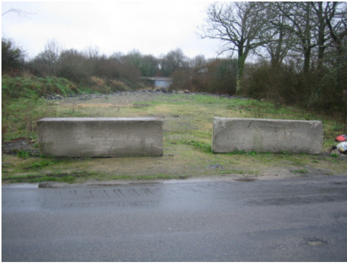
j ↑ - vue du début de la route de la Croix Rouge vers le nord.