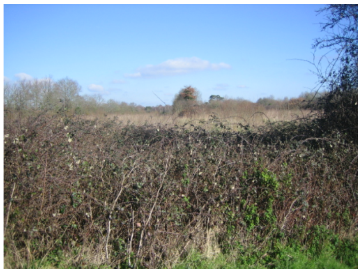
b ↑ - tracé de l'échangeur ouest, vue de la petite route de Malville vers le nord.