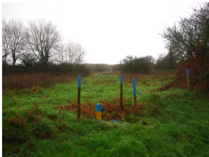
d ↑ - tracé de l'échangeur ouest, vue de la petite route de Malville vers l'est.