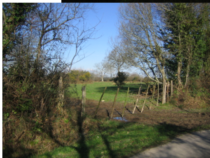
4 ↑ - tracé du barreau routier au nord de la route de la Fremière (vue de la route vers le nord)