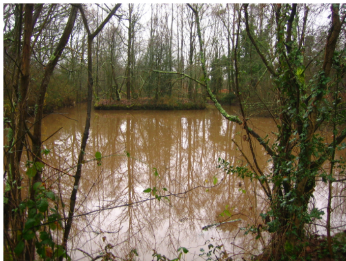
f ↑ - tracé de l'échangeur ouest, 1è mare au sud de la petite route de Malville.